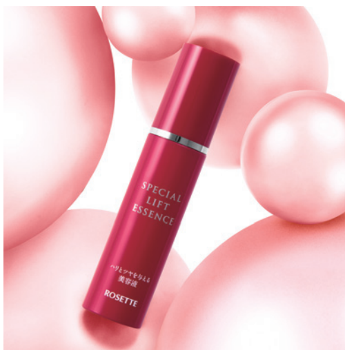
ロゼット素肌美システム スペシャルリフトエッセンス

素肌美の追求の先にみつけた黄金比 一。 厳選成分を凝縮した美容液で透明感 ※1 、なめらか、はずむ ※2 、ツヤ肌へ。