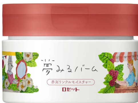
夢みるバーム 赤泥リンクルモイスチャー 90g 希望小売価格：1,800円 / 1,980円(税込)

ロゼット株式会社は、“毛穴ケア・保湿ケア・角質ケア・マッサージ・メイク落とし”を兼ねた1品5役の多機能クレンジングバーム「夢みるバーム」から、メイクをやさしく落としながら乾燥小じわを目立たなくする※1「夢みるバーム 赤泥リンクルモイスチャー」を、2021年9月21日(火)より全国のドラッグストア、バラエティショップ(一部店舗を除く)にて発売いたします。