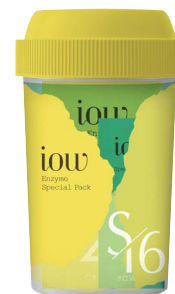
SFパック (SFパックパウダー/SFパッククリーム)

*3 古い角質 *9 すべての方に刺激が起らないというわけではありません *10 すべての方にニキビができないということではありません *14 SFパックパウダー：パパイン、プロテアーゼ、リパーゼ(清浄成分) *15 SFパックパウダー：清浄成分 *16 SFパックパウダー：モロッコ溶岩クレイ(清浄成分) *17 SFパッククリーム：グリチルリチン酸ステアリル、テトラヘキシルデカン酸アスコルビル、リノール酸レチノール(皮フコンディショニング成分)、アーチチョーク葉エキス、ポリクオタニウム-5 1(保湿成分)、セラミドNG、セラミドNP、セラミドAP(皮フ保護成分)