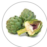
アーチチョーク葉エキス*6