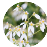
ユキノシタエキス*6