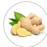
ショウガ根エキス*6