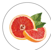
グレープフルーツ果実エキス* 5