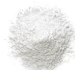
浸透型*3 ヒアルロン酸*9

*3 角質層まで *6 ヒアルロン酸ヒドロキシプロピルトリモニウム、加水分解ヒアルロン酸、アセチルヒアルロン酸Na[保湿成分] *7 ヒアルロン酸ヒドロキシプロピルトリモニウム[保湿成分] *8 アセチルヒアルロン酸Na[保湿成分] *9 加水分解ヒアルロン酸[保湿成分] ※画像はイメージです