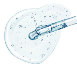
吸着型 ヒアルロン酸*7