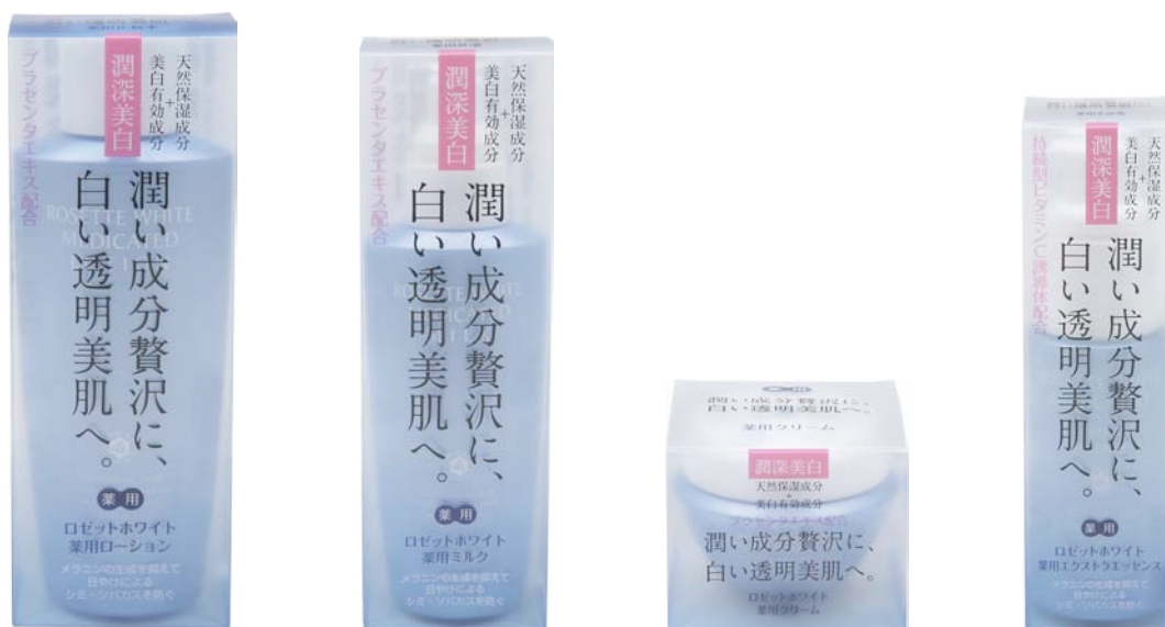
ロゼットホワイト 薬用ローション

ロゼット株式会社は、ロゼットホワイト薬用シリーズを発売し、 ベーシックケアと集中ケアで、オールシーズンの美白ニーズにお応えします。