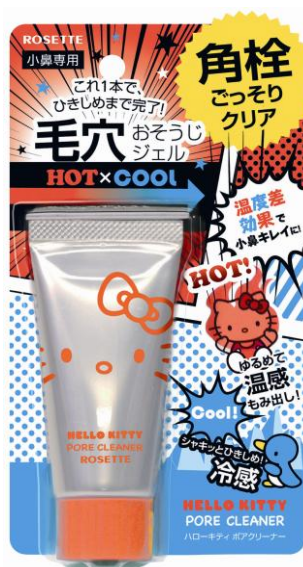
ハローキティ ポアクリーナー NEW! (30g/オープン価格)

ロゼット株式会社は、温熱効果で小鼻の角栓を取り除き、冷感効果でひきしめまで完了する『ハローキティ ポアクリーナー』を新発売いたします。