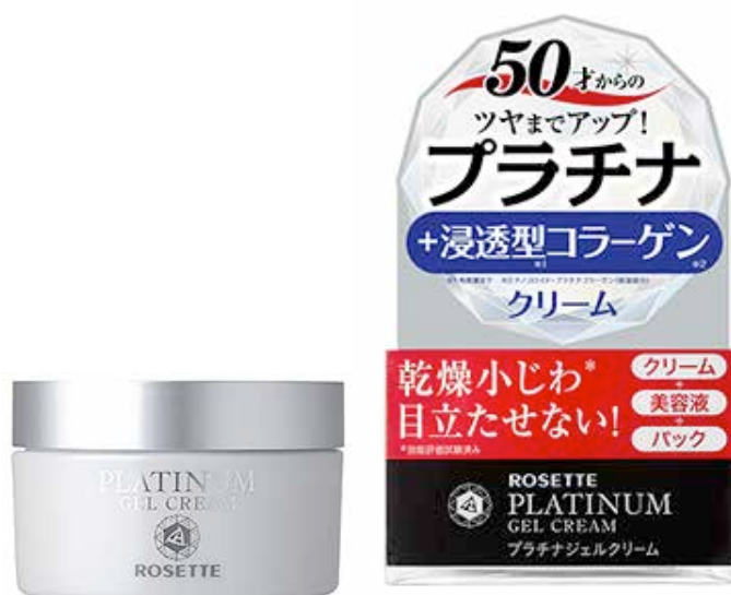
「ロゼットプラチナ ジェルクリーム」