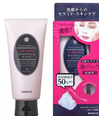
「プレミアムモイスト 泡パック洗顔料」 120g/1,000円（税抜）