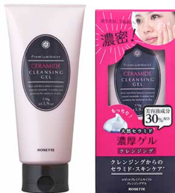
「プレミアムモイスト クレンジングジェル」 170g/1,100円（税抜）