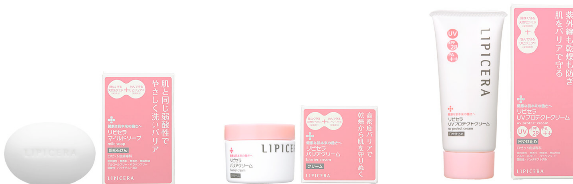
リピセラ マイルドソープ

ロゼット株式会社は、乾燥肌の健康を考えたスキンケア「リピセラ」の2011年秋の本格発売に先立ち、ロゼットオンラインショップと都内バラエティショップ限定店舗にて先行発売をスタートいたします。