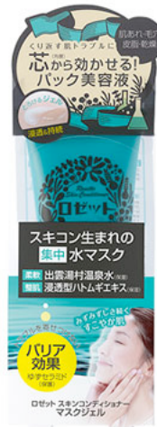
ロゼットスキンコンディショナー マスクジェル 80g/1000円(税込1050円)