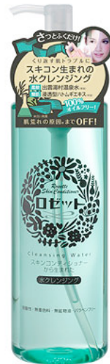
ロゼットスキンコンディショナー 水クレンジング 290mL/900円(税込945円)

スキンコンディショナーとは、乾燥だけでなく皮脂や肌あれなどバランスを崩しがちな肌のコンディションを整えるスキンケアです。ロゼットのスキンコンディショナーは、出雲湯村温泉水と5つの植物エキスを配合し、芯からすこやかな肌へ。洗浄から保湿まで毎日のトータルケアで、肌トラブルを寄せつけない肌力を育みます。