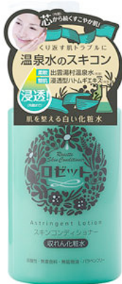
ロゼットスキンコンディショナー 200mL/1000円(税込1050円)

ロゼット株式会社は、肌あれ・毛穴・皮脂・乾燥など様々な肌トラブルを整える『ロゼットスキンコンディショナー』『ロゼットスキンコンディショナー マスクジェル』『ロゼットスキンコンディショナー 水クレンジング』を新発売いたします。